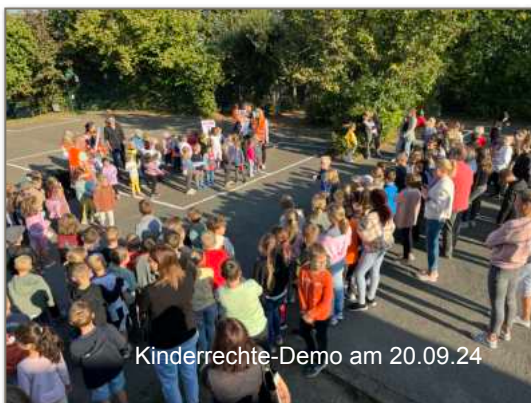
Kinderrechte-Demo am 20.09.24

Unsere Zweitklässler, inzwischen erfahrene Grundschulkinder, wurden bei ihrer Rückkehr aus den Ferien von einer komplett neuen Klassen-Möblierung überrascht. So sind inzwischen vier von acht Klassen mit Mobiliar ausgestattet, das flexible Anordnungen ermöglicht. Unsere Klassenräume werden mehr und mehr zu Tagesräumen, also zu Orten, die morgens Unterricht ermöglichen und nach der letzten Stunde auch zum Spielen und Entspannen einladen sollen.