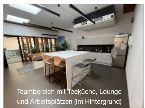
Teambereich mit Teeküche, Lounge und Arbeitsplätzen (im Hintergrund)

Nachdem unser neuer Teambereich im Verlauf des Jahres weitgehend fertiggestellt werden konnte, stagniert der Umbau von Tages- und Themenräumen nun schon seit geraumer Zeit. Doch 2025 hält neue Perspektiven bereit.