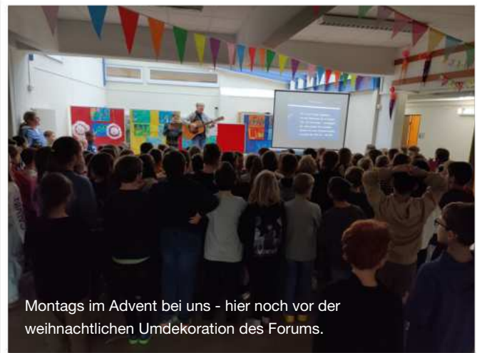
Montags im Advent bei uns - hier noch vor der weihnachtlichen Umdekorierung des Forums.

Im Dezember weihnachtete es in allen Klassen und zunehmend auch in unserem Forum. Es wurden Plätzchen gebacken, Deko und Geschenke gebastelt. In manchen Ecken zogen sogar Weihnachtswichtel ein. Montags trafen sich alle nach der Pause zur gemeinsamen Adventsfeier.